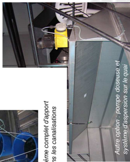
Autre option : pompe doseuse et système d'aspersion sur le qual