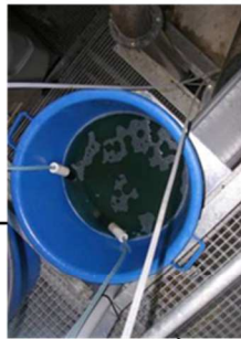
Bac de solution et crépines de pompage